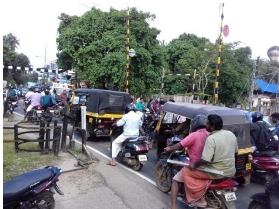
ഗേറ്റ് തുറന്നപ്പോഴത്തെ ഗതാഗതക്കുരുക്ക്