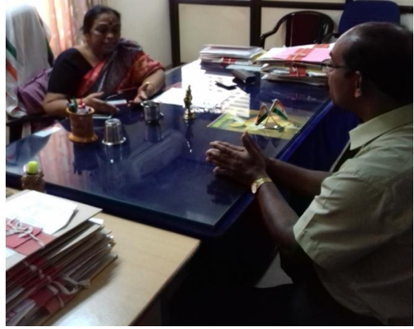
മുനിസിപ്പൽ അധ്യക്ഷനുമായുള്ള ചർച്ച