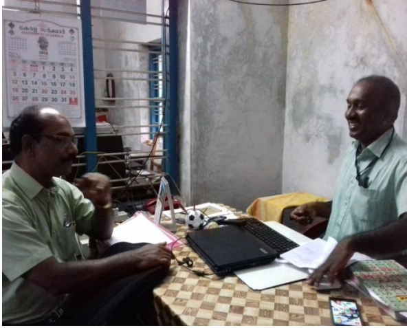
വില്ലേജ് ഓഫീസുമായുള്ള ചർച്ച