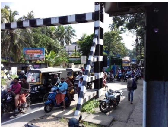
ലവൽക്രോസ്സിലെ ഗതാഗത തടസ്സം